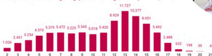
Aantal interventies rond gedragsproblemen volgens leeftijd in 2023-2024

Bij de overgang van basis- naar secundair onderwijs (tussen 11 en 13 jaar) pieken de aanmeldingen voor moeilijk hanteerbaar gedrag . We zien een opvallende kloof tussen het basis- en het secundair onderwijs. Vanuit deze vaststelling is de CLB-sector vragende partij voor verder onderzoek naar mogelijke oorzaken hiervoor en bijhorende praktijk- en beleidsaanbevelingen. We merken op dat onze opdracht vandaag vaak curatief is. Daarom willen we vroeger impact hebben door preventief en nabij scholen en leerkrachten te ondersteunen. Hiervoor hebben we ruimte nodig. Daarom blijven we aandringen op een ruimer hulpverleningsaanbod zonder wachtlijsten.