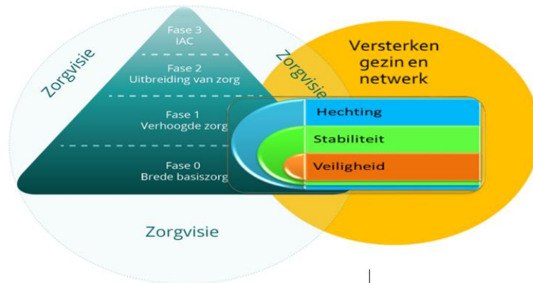
Figuur 2: Traumasensitieve zorg in het zorgcontinuüm.

De school kan vooral een rol spelen in fase 0 en 1 door op een cultuur- en traumasensitieve manier les te geven, te voorzien in een veilige en stabiele leeromgeving en te zorgen voor een pedagogische omgang met traumabepaalde reacties. Het CLB kan hier ondersteuning bieden door het geven van advies en duiding bij trauma. In fase 2 speelt het CLB vooral een rol door het opstarten van een leerlinggebonden traject om de leeransen optimaal te benutten.